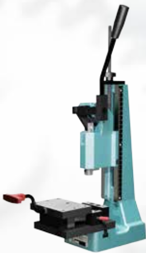
EP 500 avec MST 80