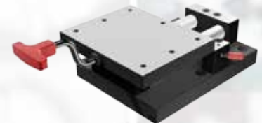
MST 80 MST 100