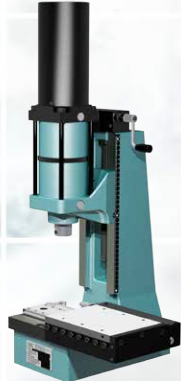
Montage par le côté