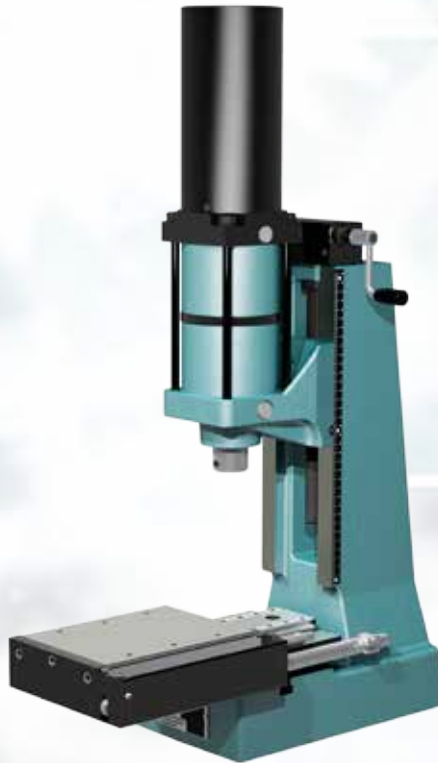
Presse type DA avec PST 130 Montage par devant